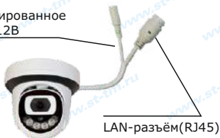
Рис. 1 Схема подключения видеокмеры