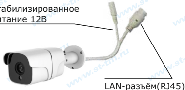
Рис. 1 Схема подключения видеокмеры