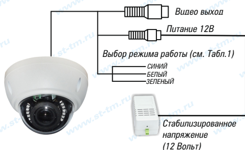
Рис.1 Схема подключения